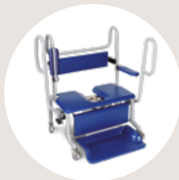
Carmina® SWL* 320kg