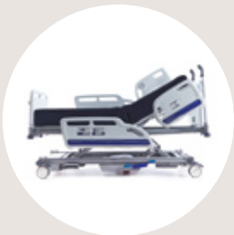
Citadel® Plus SWL* 454kg