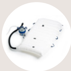
Maxi Air® luftunterstütztes Transfersystem SWL* 544kg MaxiSlide® Gleitmatten