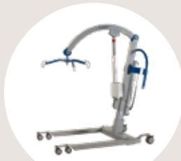
Tenor® und Gurte für den Sitztransfer SWL* 320kg