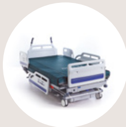
AtmosAir® Plus SWL* 454kg