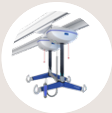
Maxi Sky® 2 Plus und Gurte für den Sitz- und Liegendtransfer SWL* 454kg