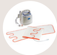
Flowtron ACS900 Pumpe mit Tri Pulse oder TVT 60 L-Manschetten - für einen Wadenumfang von bis zu 81cm