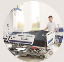
Skin IQ® 1000 SWL* 454kg