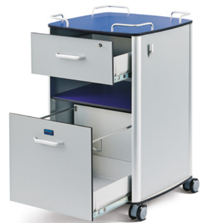
Der Nachtschrank (Bedside Cabinet) hat zwei große Schubladen, die leicht von dem Bediener zu erreichen sind.