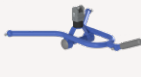
Flad manuel 4-punkts Dynamic Positioning System