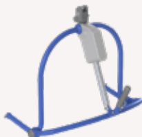
Medium og stor 4-punkts Powered Dynamic Positioning System