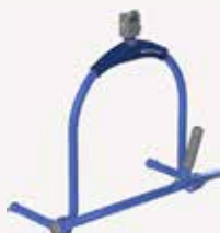
Manuel 4-punkts Dynamic Positioning System