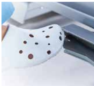
Voetschakelaar voor hoogteverstelling