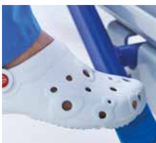
Niet-aangedreven vijfde wiel