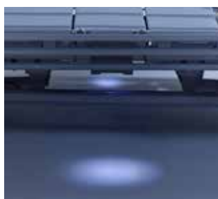
Verlichting onder het bed