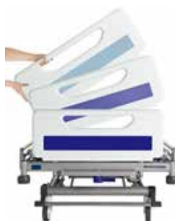
Kleuropties voor de panelen