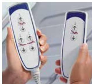
Handbedieningen voor de zorgvrager