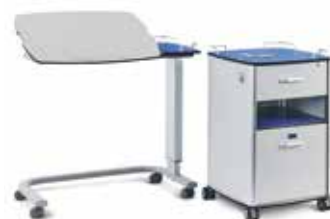
Bedtafels en nachtkastjes